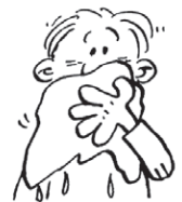
Respirer à travers un linge humide