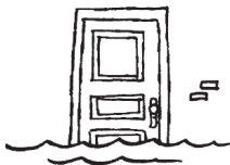
Fermer les portes