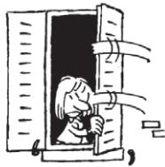
Se mettre à l'abri dans un bâtiment