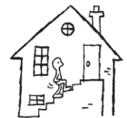
Monter à pied dans les étages