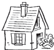
Sortir et s'éloigner des bâtiment